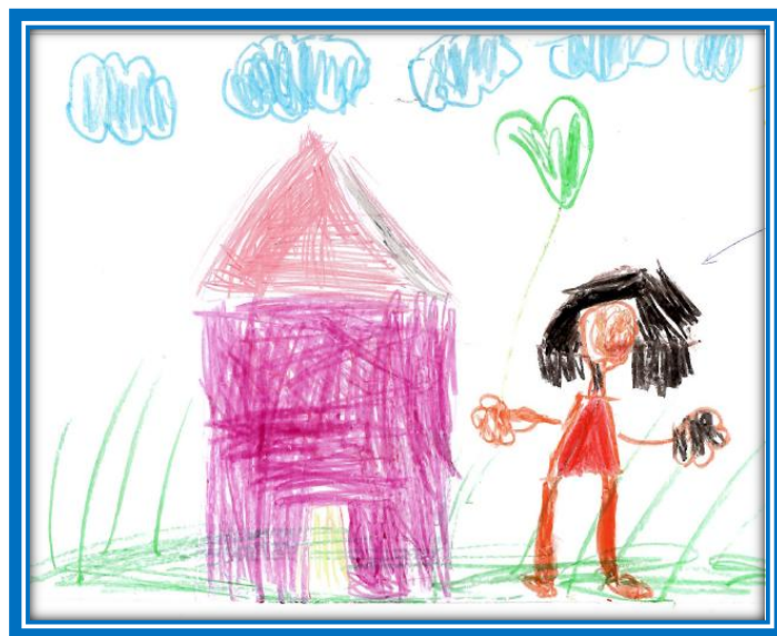
Von Dalia, 5 Jahre

AWO Interkulturelles Kinder- und Familienzentrum